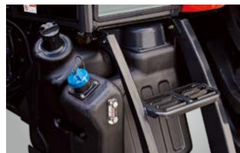
Veliki rezervoar za gorivo

Standardne teleskopske poteznice sa stabilizatorima omogućuju korisniku jednostavno i brzo priključenje raznih priključaka. Vanjsko upravljanje omogućuje praktično dizanje i spuštanje hidraulike bez ulaska u traktor.