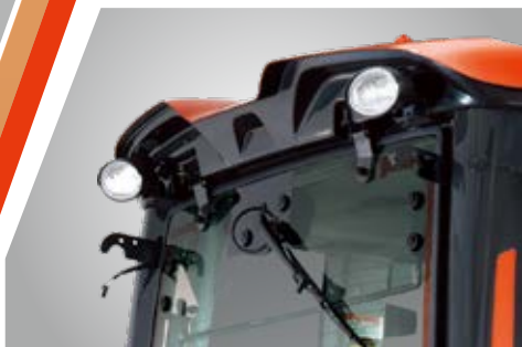
Stražnja radna svjetla

Inteligentno dizajnirana i potpuno izolirana od mehaničkog dijela, kabina novih HX traktora nudi razinu udobnosti, prostranosti, opremljenosti i jednostavnosti s kojom se nijedan drugi traktor ove snage ne može mjeriti. Kabinu karakterizira veliki unutarnji prostor što pruža udobnost i lakoću vožnje, posebno visokim osobama.