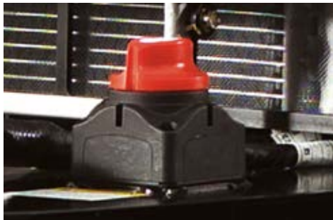
Prekidač za isključenje baterije

Turbom pogonjen motor sa hladnjakom stlačenog zraka osigurava HX seriji snagu koja je korisniku potrebna u svim režimima rada. Dvostruki zračni filter omogućuje dodatnu filtraciju i produženi vijek trajanja filtra.