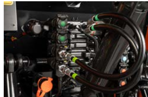
Stražnji hidraulični priključci

Standardno ugrađen na traktorima iz HX serije, omogućuje jednostavno isključenje baterije kad se traktor ne koristi duže vrijeme i povećava vijek trajanja baterije.