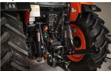
Stražnji prihvat u 3 točke

Svi modeli dolaze serijski opremljeni sa prednjim i stražnjim brisačem koji su pozicionirani tako da ne smanjuju preglednost vozaču. Grijač stražnjeg stakla od posebne je koristi u hladnim klimatskim predjelima.