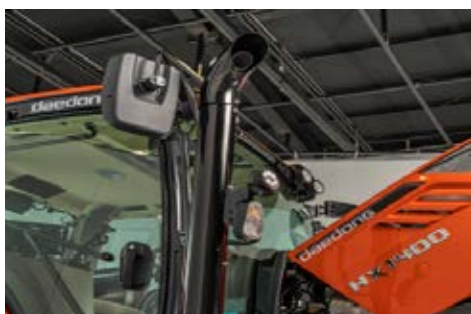
Prednja radna svjetla

Sa dva standardna podesiva stražnja radna svjetla, korisnik može sigurno upravljati traktorom i u uvjetima smanjene vidljivosti. Još dva stražnja svjetla dolaze kao opcija za dodatno poboljšanje vidljivosti.