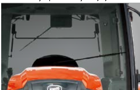
Standardni brisači i grijač stražnjeg stakla

HX serija standardno dolazi sa ventilom za Joystick i 4 stražnja hidraulična priključka za upravljanje prednjim utovarivačem i raznom drugom opremom. Treći par hidrauličkih priključaka dolazi kao opcija.