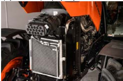
Turbo Dizel motor sa interkulerom

Standardna bočna radna svjetla omogućavaju znatno bolju vidljivost kod skretanja.