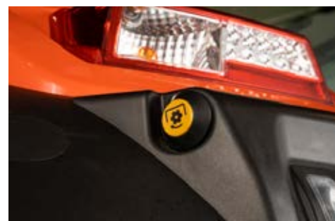
Bočna radna svjetla

Četiri podesiva prednja radna svjetla dolaze standardno na XX seriji, omogućavajući korisniku maksimalnu vidljivost u svim uvjetima.